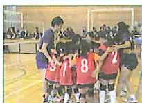
2013.8~継続中 立教バレーボール教室 @陸前高田 体育会バレーボール部 体育会女子バレーボール部