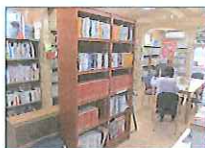
2013.6 陸前高田市立(仮設)図書館への 書架寄贈 東日本大震災復興支援本部、 学校・社会教育講座事務局、図書館