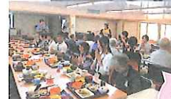
地元の方々と一緒に「いただきます」