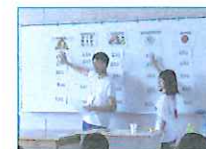
2019.7~継続中 サービスマーケティングC (イングリッシュ・キャンプ) 異文化コミュニケーション学部