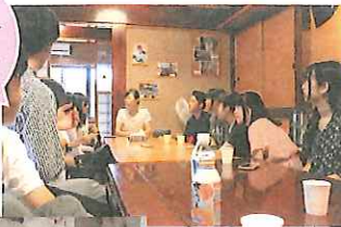
常宿にしている唐桑の民宿つなかにて思いがけない女将さんの深い話に聞き入る

東北に赴き、東北の方々と対話するという。そこから見出される学びは、私の「被災地の現状を知りたい」という表面的な参加動機を大きく超えてくるものでした。「この震災とは何だったのか」というテーマを核として始まる双方向的なコミュニケーションのなかでの、言葉と感情の交流。そのなかで私は、震災を単なる凄惨な出来事としてではなく、いかに人の「生」が狂わされ、損なわれたのかという視座から捉え、広く深く思考できるようになっていきました。フィールドに赴き「出会う」なかで、得られる気づきが本当に多くありました。また、同じフィールドに一度行って終わるのではなく、何度も繰り返し行くことにこの活動の大きな意義があったと思います。なぜならば、東北の方々と対話と関係を積み上げていくなかで、自らの思考が繰り返し相対化され、更新されていくことをひしひしと感じたからです。この、妥協せず考え抜く姿勢は、今でも私の大切な基礎となっています。あたたかく私たちを迎えてくれた東北のみなさま、支えてくださった立教大学関係者のみなさまに、心からの感謝を申し上げます。「震災を知る」という地平にとどまらないこの活動が、いつまでも続いていくことを切に願います。