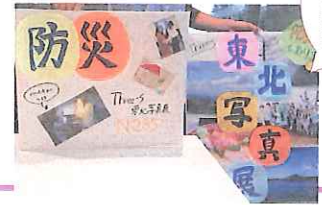
学園祭にて写真展を 開催！来場者と震災 や防災に関してお話 をし、復興の現状や 学生の取り組みを共 有しました