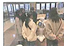
2018.8~2020 ICT教育の実践による コミュニティ支援(寄附講座) 社会学部