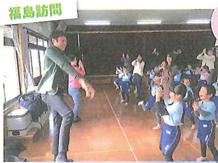
訪問先の幼稚園児たちと「ハプリカ」をおどる

2011年11月に学生キリスト教団の学生有志で郡山ベージェント隊を結成し活動を開始しました。2014年2月、チャプレン室は学生キリスト教団と共に「復興支援プロジェクト 東北巡礼キャラバン隊〜よりそのための3日間〜」を実施しました。2012年から2015年まで池袋クリスマス実行委員会が郡山プロジェクトとして、2015年・2016年には立教学院諸聖徒礼拝堂ハンドベルクワイアが『福島の子どもの笑顔をつくり』隊として、年に一度、福島の子どもたちと交流を深めました。2017年からは学生キリスト教団を統括する代表委員会が活動を引き継ぎ、2019年には「立教大学学生キリスト教団 福島訪問」として実施しています。子どもたちはもちろん、幼稚園の先生や帰還困難地域の『語り部』の方等とも交流し、お話を伺いながら、震災後の被災地の現在を知り、被災した方々や子どもたちの心に寄り添う活動を継続しています。