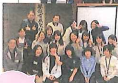
気仙沼68期。中学生さんきょう会にて