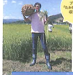
ブランド米「たかたのゆめ」の収穫を体験