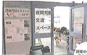
投票の台 学生が集 まし

本学学生が取り組む様々な復興支援活動の相互連携を促進するとともに、学生が新たに活動を始めきっかけとなる情報や機会を提供することを目的に、2013年7月から2016年3月まで池袋キャンパス5号館1階に「東日本大震災復興支援スペース」を開設しました。復興支援活動に関わる学生が集い、交流会、写真展、説明会等の様々なイベントを開催する場として活用されました。