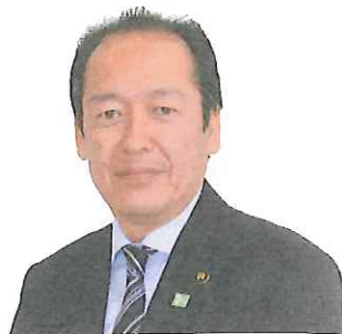
陸前高田市長 戸羽 太

結びに、これまでのご支援と友情に心からの感謝を申し上げますとともに、立教大学の益々のご発展をご祈念申し上げメッセージといたします。