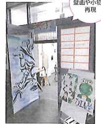
カエル塾の 壁面や小物を 再現