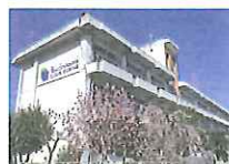
2017.4~継続中 陸前高田グローバルキャンパス 開設