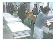
2011.3 帰宅困難者の受け入れ