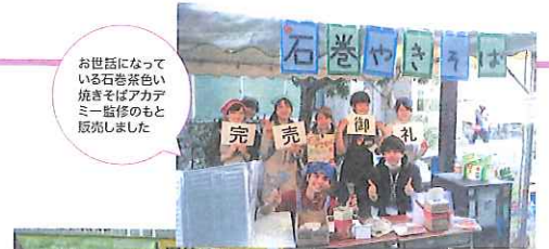
お世話になって いる石巻茶色い 焼きそばアカデ ミー監修のもと 販売しました

震災発生当時の学生ボランティア不足に際し、「何かしたい」特別な技術や知識のない学生を被災地へとつなげるべく、立教大学内に学生による復興支援の拠点が必要と考え、2011年6月7日に学生5名により設立されました。MISSIONは「『何かしたい』を『何か出来る』へ」をモットーに、1人ではなかなか1歩を踏み出せない学生の想いを、みんなで、学内で、都内で、現地で…など様々な活動を通し復興を応援すること、そして「風化防止と伝える活動」。学園祭での石巻やきそば販売等による啓発活動、石巻・女川交流プログラム等の現地活動、新宿区社会福祉協議会や他大学の学生と連携した新宿区避難者支援・地域活性化活動、広報活動、防災啓発活動等を行ってきました。