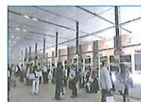
2013.5~2016.7 「つながる。陸前高田と立教大学」 交流展 学内パネル展示 東日本大震災復興支援本部