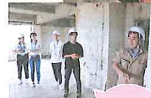
津波で被災した米沢商会ビルで地元の方からお話を伺う