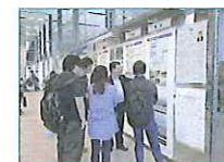
2013.10~2015.12 「つながる。陸前高田と立教大学」 交流展 ホームカミングデー・パネル展 東日本大震災復興支援本部、校友会