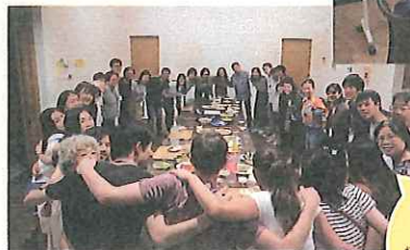
プログラムでお世話になった方を招き、感謝の気持ちを伝えるパーティ