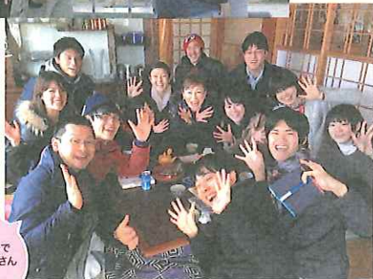
掘りこたつで民宿の女将さんと共に