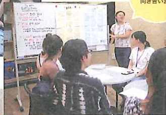
グループワーク じっくり課題向き合います