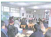
2013.6~2017.12 陸前高田スタディツアー 東日本大震災復興支援本部、 国際センター