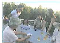
2014.2~継続中 陸前高田プロジェクト グローバル教育センター