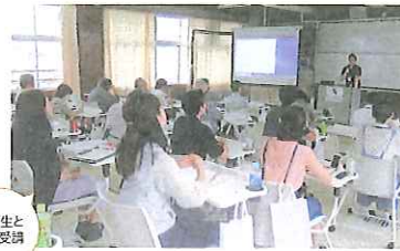
立教生と共に受講