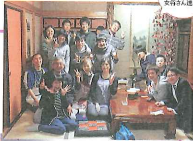
唐桑の民宿 つなかに1 元気はしけり 文得さん選と

東日本大震災直後に現地支援に向かった立教生が2011年6月7日に結成しました。社会学部と協力しながら、2011年には学外の復興支援団体と連携し被災地域へ学生を繋ぐ窓口となり、2012年からは現地活動や新宿区避難者支援・地域活性化活動を開始しました。現地活動は「唐桑ツアー」という名称で、気仙沼市唐桑町と陸前高田市に足を運び続けています。「被災地」ではなく「唐桑」へ行く、「被災者」ではなく「〇〇さん」に会いに行くという感覚の変化や、「来てくれるだけでいい」という地域の人びとの言葉に、本当に行くだけでいいのか、行き続けることの意味とは何かという疑問に向き合い、地域の人びとに打ち明け、共に考え悩みながら、それでもこの場所や人びとに魅了され、訪れ続けています。