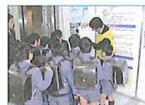
2012.12~2016.12 「つながる。陸前高田と立教大学」 交流展 ～東日本大震災を忘れないために 立教大学