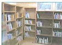
2012.11 図書館施設備品の寄贈 東日本大震災復興支援本部、 図書館