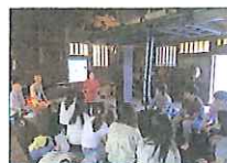
2016.4~継続中 立教サービスマーケティング (RSL) 立教サービスマーケティングセンター ※陸前高田市以外でも実施