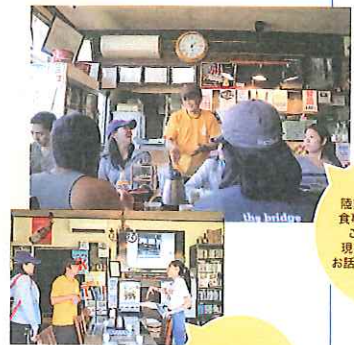
陸前高田の美味しい食事をいただいた後、これまでの歩みと現在の課題についてお話をうかがっています