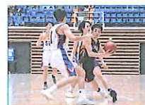
2018.3 岩手県陸前高田市総合交流センター 開設記念プレイベント 第14回 東京六大学バスケット ボールリーグ戦 陸前高田大会 立教大学、陸前高田サテライト共催