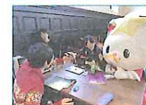
2014.11~2017.12 たかたのゆめフェア (陸前高田市ブランド米の 学食販売) 東日本大震災復興支援本部