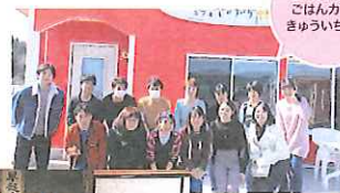
いわき26期。ごはんカフェきゅういちにて

2015年4月～2019年3月まで引率スタッフを務めました。南三陸町、気仙沼・大島、いわき・楡葉の3拠点を担当しました。拠点によって体制も違いましたが、現地コーディネーターや担当教員、学生達と話し合いをしながらプログラムを考えました。学びに行かせて頂く・お邪魔させて頂くというスタンスは大事にしていたので、常に学生たちに伝えていたと思います。あとは学生たちにプログラムを通して自ら考える力や主体性を身に付けてもらえたら良いなと思っていました。プログラムでの経験を得て、現地の方と一緒にまちづくりをしてみたいと思うようになり、2020年5月に気仙沼市に移住をしました。現在は「気仙沼まち大学運営協議会」の地域おこし協力隊として活動する傍ら、ブレイクダンスを通した身体表現の楽しさを発信する団体「KESENNUMA BREAKERS」を立ち上げて活動しています。また気仙沼のダンススクールにも所属して、子ども向けのダンス教室をしています。