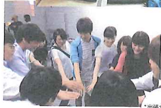
「出張カエル塾」 本日前…!