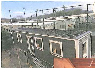
全戸で普及が進んでいます

2020年2月、災害時に福祉避難所や応急仮設住宅として利用できる移動式木造住宅「ムービングハウス」を全国で初めて内覧・体験可能な形で設置し、関係者による1泊2日の体験型研修プログラムを試行しました。ムービングハウスは、平常時はホテルや研修施設等として利用し、災害時はトラックに貨物として載せて瞬時に移動させ、福祉避難所や仮設住宅として利用する「社会的備蓄」が可能な施設です。今後は、全国の自治体で防災を担当する職員向けの研修プログラムなども企画・実施する予定です。