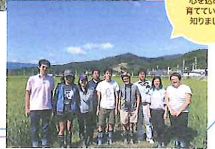
農業の復興のシンボルをいかに心を込めて育てているか知りました