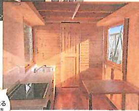
天然木による暖かな内装