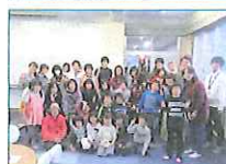
2017.12~継続中 みんなでわいわいクリスマス 東日本大震災復興支援団体 Frontiers Three-S