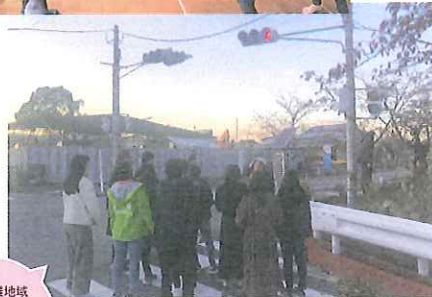
帰還困難地域(高岡町)にて『語り部』の方からお話をうかがう